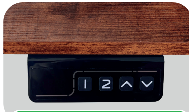
Controle de Comandos

A gaveta embutida é o complemento ideal, proporcionando uma solução prática e elegante para organizar seus itens de trabalho.