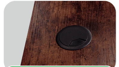
Organizador de Fios

O controle de comandos oferece uma experiência personalizada e eficiente no ajuste da altura da sua estação de trabalho.