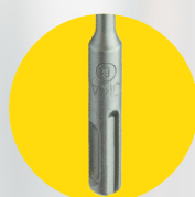
ENGATE SDS PLUS