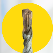
PONTA EM COBRE