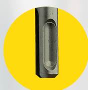
ENGATE SDS PLUS