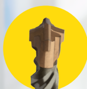
PONTA EM COBRE