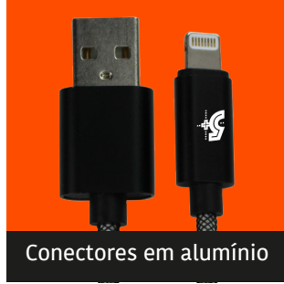
Conectores em alumínio

Cabo Sync & Charge Black Series Cabo USB + Lightning para carga e sincronização de dados.