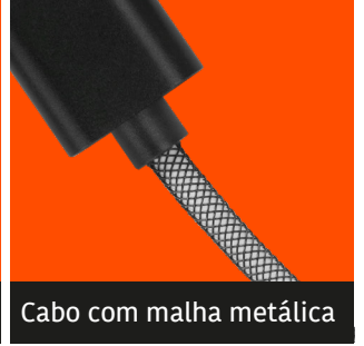
Cabo com malha metálica