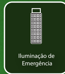
Iluminação de Emergência