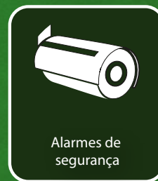
Alarmes de segurança